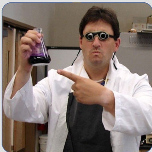
Finalmente... Il grande Ciumbia Molotròv

Ormai anche i sassi hanno letto l'ormai famoso articolo pubblicato dalla prestigiosa rivista "Journal of Radio Elettra School" nel quale si rivelano i fondamenti della tanto attesa cura per la distrofia muscolare. Cerchiamo qui di